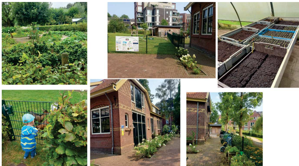
Fotografia 5. Ogród społeczny w Wageningen

W Holandii rozwój idei społecznych w zakresie zakładania ogrodów jest koncepcją rozwijaną od dawna. Na obszarze Holandii jest blisko 600 tego typu obiektów, ponieważ stanowią one ciekawą enklawę, a ich funkcjonowanie różni się od tego, które funkcjonuje w Polsce. W Holandii ogród społeczny, inaczej nazywany społecznościowym, to miejsce, w którym mieszkańcy mogą uprawiać warzywa, owoce, kwiaty. W niektórych ogrodach społecznościowych lokalni mieszkańcy mają mały ogródek warzywny, na przykład w drewnianym pojemniku. W takim przypadku to właściciel odpowiedzialny jest za swój własny kawałek ogrodu. W innych ogrodach za wszystko, co rośnie, odpowiada każdy (Hassin in., 2019). Przykładem ciekawego miejsca i ogrodu społecznego jest obiekt zlokalizowany w mieście Wageningen w Holandii pn. Stadsboerderij Wageningen (fot. 5).