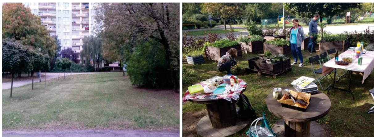
Fotografia 3. Lokalizacja ogrodu (z lewej: plac, na którym powstał ogród, z prawej: wykonanie)