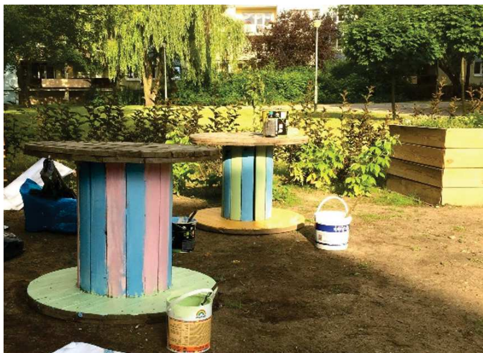
Fotografia 4. Społeczne malowanie ogrodu