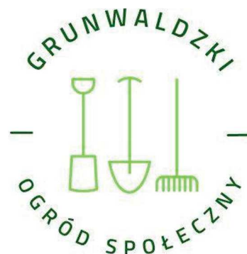
Rysunek 2. Logo ogrodu społecznego w Poznaniu

W ramach funkcjonowania ogrodu społecznego przeprowadzono wiele różnych imprez, m.in. spotkanie z kulturą nepalską, kino w ogrodzie, halloween dla dzieci, noc świętojańską, warsztat dendrologiczny, konkursy plastyczne, spotkanie z ornitologiem, „Herbaciane spotkanie w ogrodzie”, akcje „Sadzimy sadzonki”, festyny rodzinne, warsztat „Tajemnicze życie pszczołek murarek” i wiele innych inicjatyw.