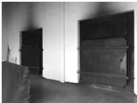
Fotografia 1. Włazy kotła, którymi dostarczane są bele słomy