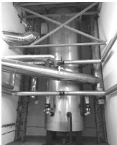
Fotografia 3. „Serce” kotłowni na biomasę