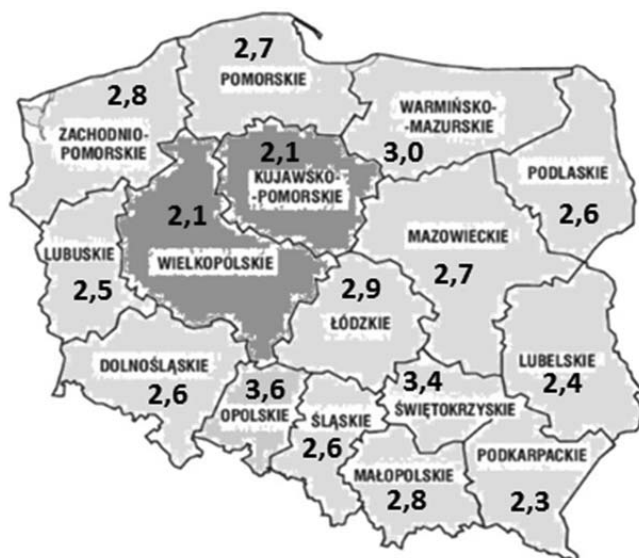
Rysunek 5. Liczba miejsc w DPS-ach w województwie przypadająca na 1 tys. mieszkańców w roku 2017