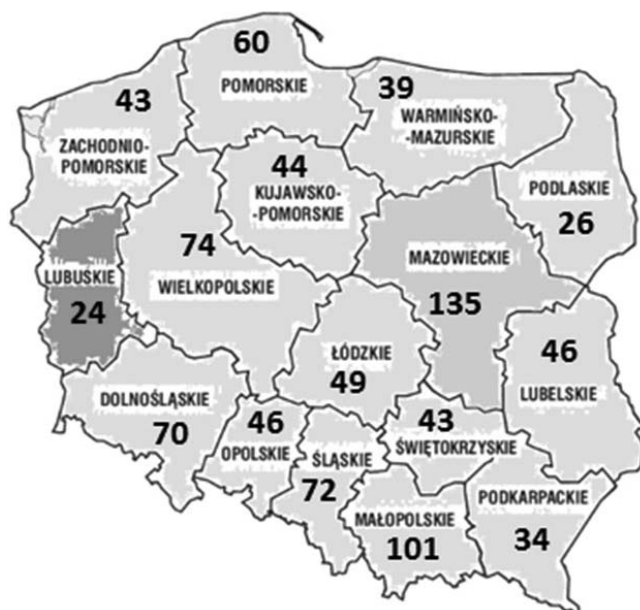
Rysunek 2. Liczba DPS-ów w gminach wiejskich w 2017 roku