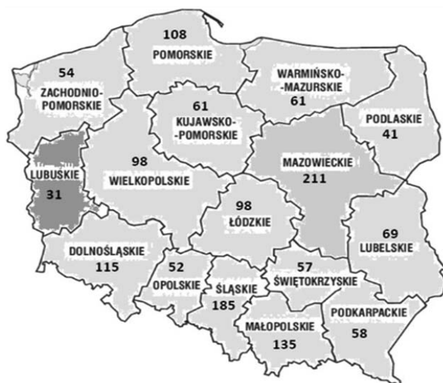
Rysunek 1. Ogólna liczba DPS-ów w skali kraju w 2017 roku

Lokalizacja i dostępność do DPS-ów w skali kraju jest zróżnicowana. Ich rozmieszczenie uwzględniając tereny miejskie i wiejskie łącznie, przedstawiono na rysunku 1.