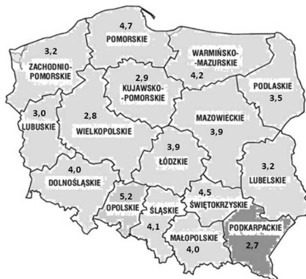
Rysunek 3. Liczba DPS-ów w województwach na 100 tys. mieszkańców w 2017 roku