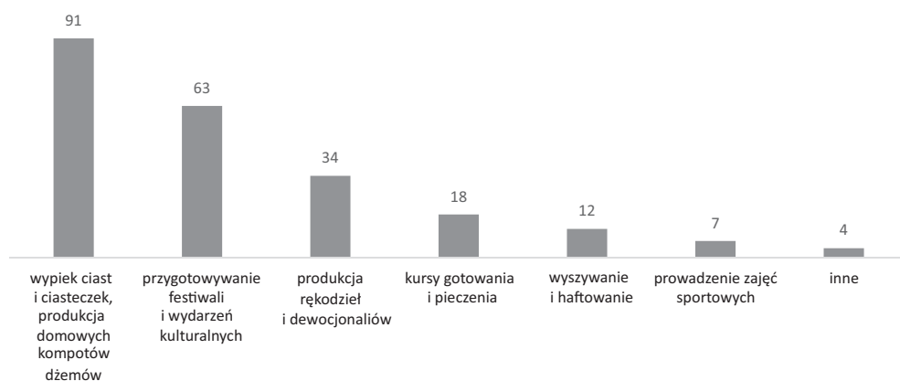
Rysunek 2. Działalność prowadzona przez KGW w powiecie gnieźnieńskim (%)