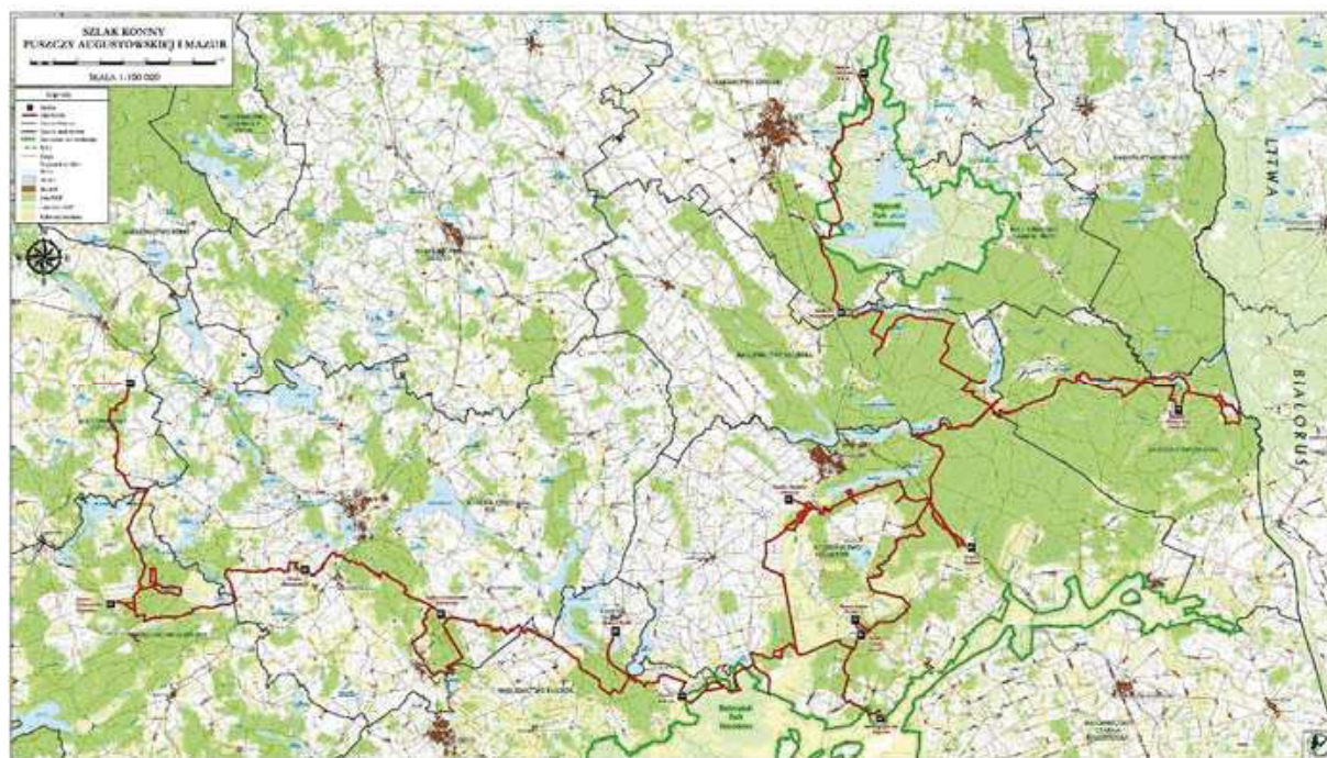
Rysunek 1. Szlak Konny Puszczy Augustowskiej i Mazur

Szlak Konny Puszczy Augustowskiej i Mazur jest drugim co do długości (400 km) szlakiem konnym w Polsce, przebiegającym przez teren województw podlaskiego i warmińsko-mazurskiego i łączącym Wigierski Park Narodowy, Biebrzański Park Narodowy oraz Puszcze Augustowską (rys. 1). Trasa szlaku prowadzi od leśniczówki Lipniak w Wigierskim Parku Narodowym (na północ od Suwałk) przez nadleśnictwa: Suwałki, Szczebra, Płaska, Augustów, Biebrzański Park Narodowy, nadleśnictwa: Rajgród, Etk i Drygały aż do jeziora Orzysz. Boczne rozgałęzienia szlaku docierają do atrakcyjnych miejsc, tj. śluz Kurzyniec na granicy polsko-białoruskiej oraz uroczyska Grzędy w Parku Biebrzańskim. Na szlaku dominują jazdy treningowo-spacerowe w sąsiedztwie ośrodków jeździeckich, a ich uzupełnieniem są rajdy konne. Częstotliwość użytkowania rajdowego jest niewielka na obszarze Nadleśnictwa Suwałki (w północnej części szlaku) – z reguły nie przekracza kilku rajdów na rok i jest największa na terenie Nadleśnictwa Augustów.