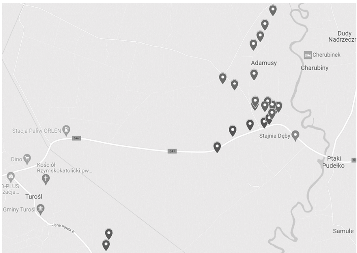
Rysunek 1. Rejon umocnień Galindestellung na obszarze gminy Turośl

Schrony w gminie Turośl znajdują się na obszarze miejscowości: Adamusy (w tym w ich części Podgórze), Trzczańskie, Ptaki i Turośl (gdzie miejsce lokalizacji schronów określane jest jako Góra Dyliki). Obiektów łącznie jest 22, z czego w samej Turośli są tylko 2 schrony. Rozmieszczenie przestrzenne wszystkich fortyfikacji gminy przedstawiono na rysunku 1.